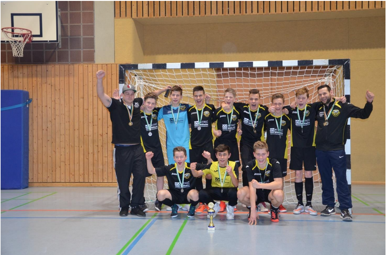
Sieger C-Junioren JFV Rhein-Hunsrück