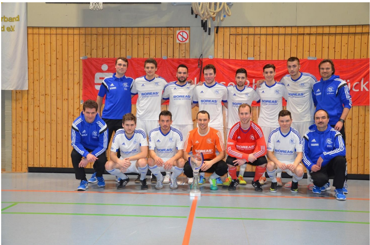
Sieger Masters 2016 - FC Karbach