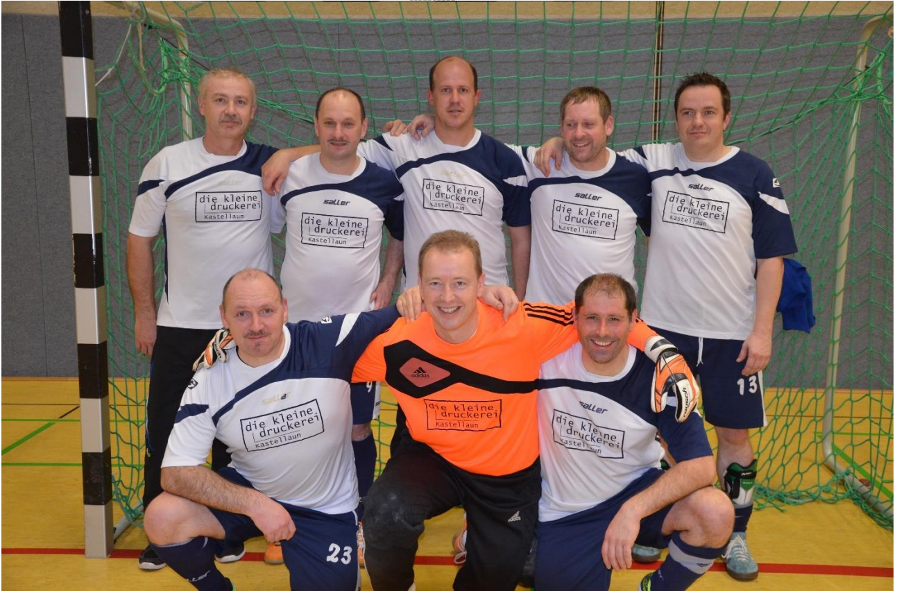
Sieger Ü40 SVC Kastellaun