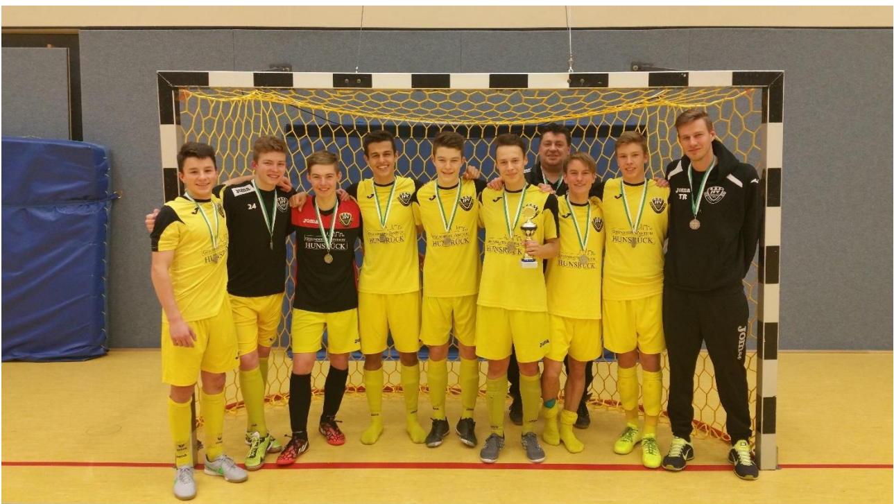
Sieger B-Junioren JFV Rhein-Hunsrück