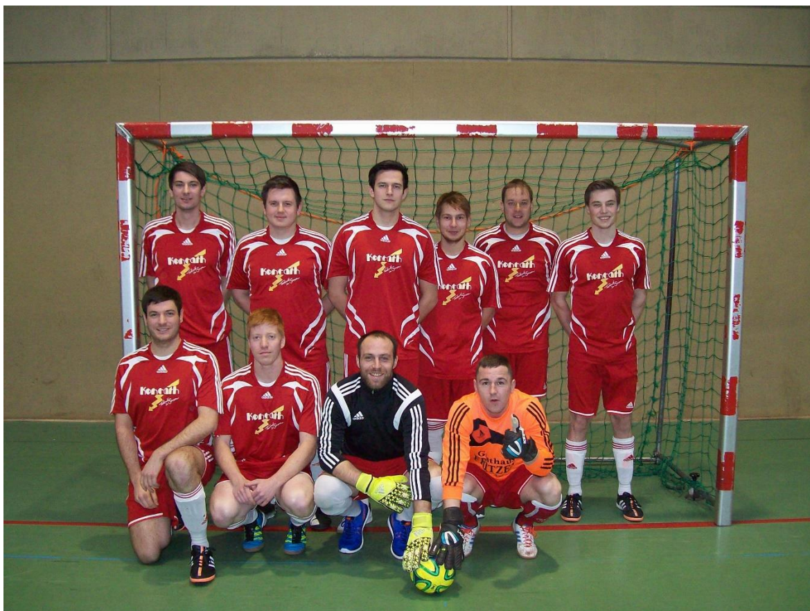
Sieger Senioren SV Büchel