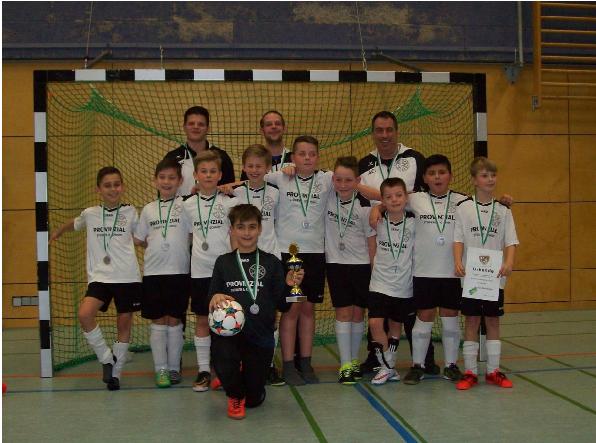
Sieger E-Junioren JSG Rheinböllen