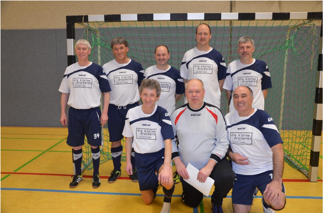
Sieger Ü50 SVC Kastellaun