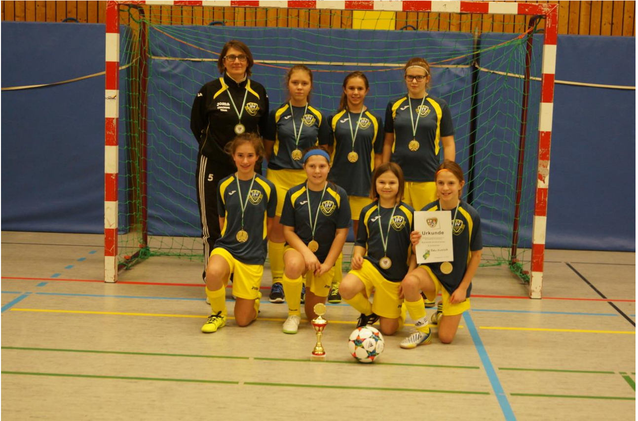
Sieger D-Juniorinnen JFV Rhein-Hunsrück