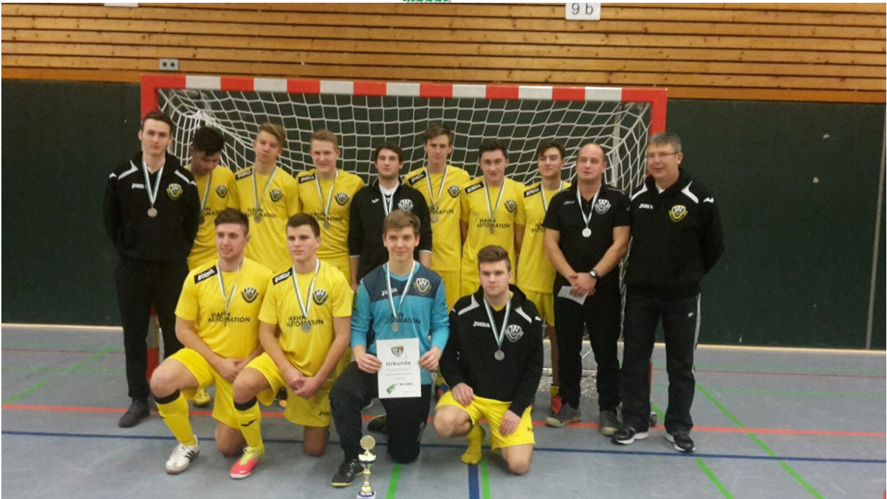
Sieger A-Junioren JFV Rhein-Hunsrück