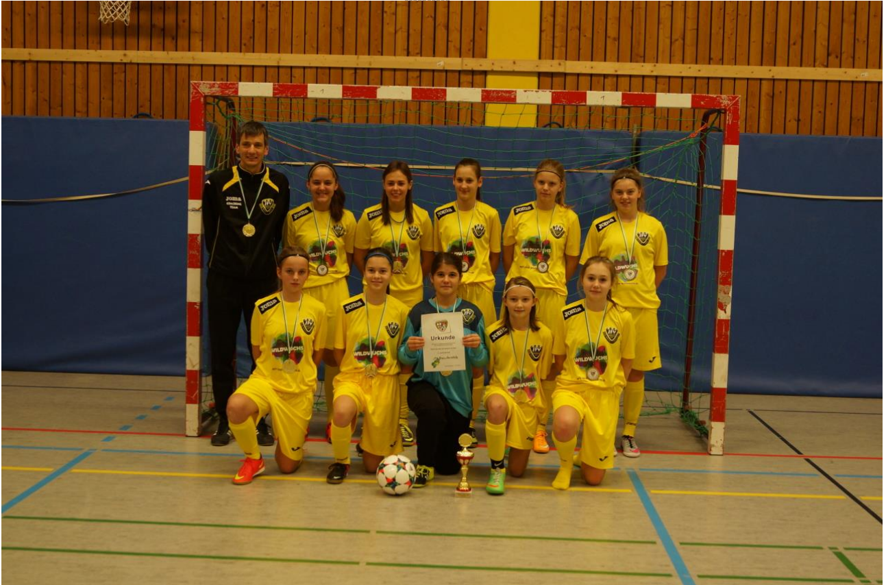
Sieger C-Juniorinnen JFV Rhein-Hunsrück