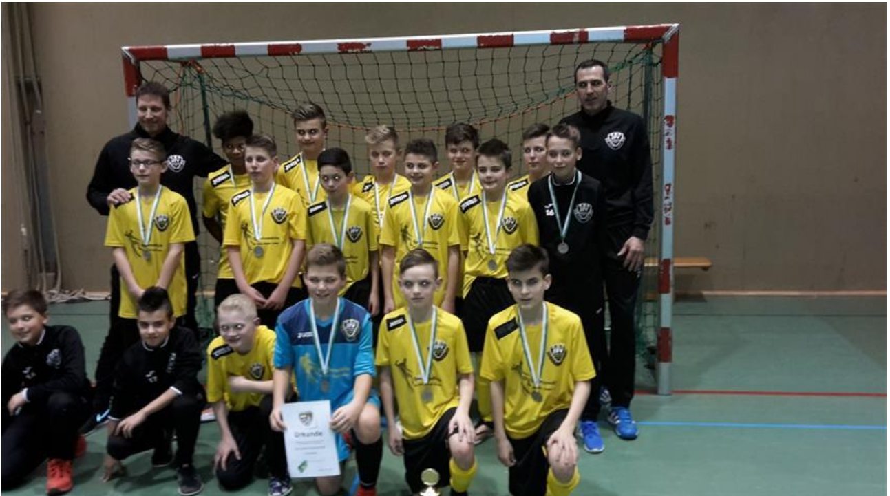
Sieger D-Junioren JFV Rhein-Hunsrück