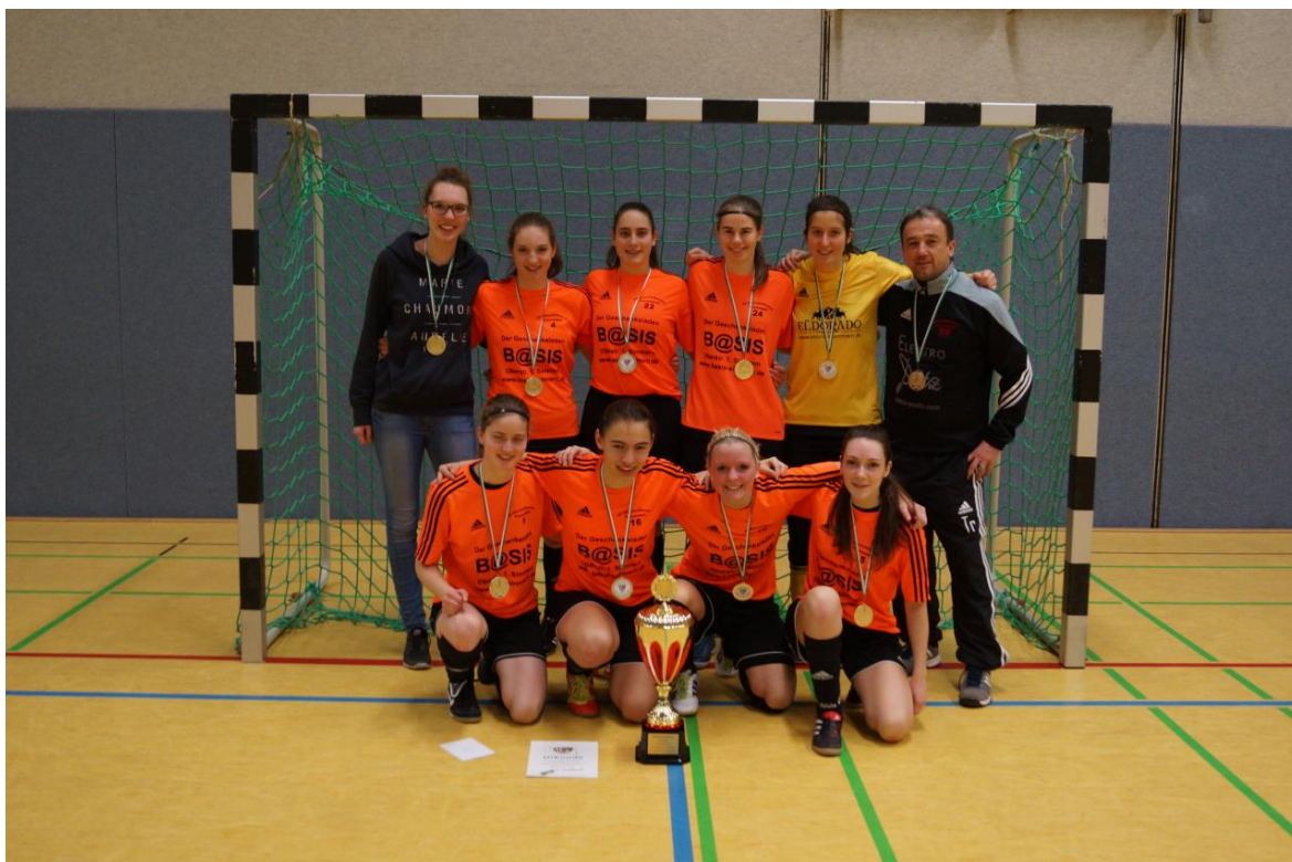
Sieger Frauen SV Holzbach