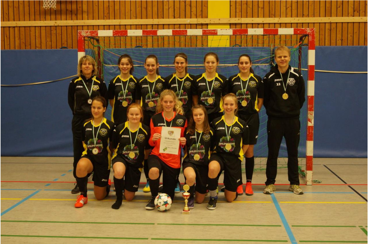
Sieger B-Juniorinnen JFV Rhein-Hunsrück