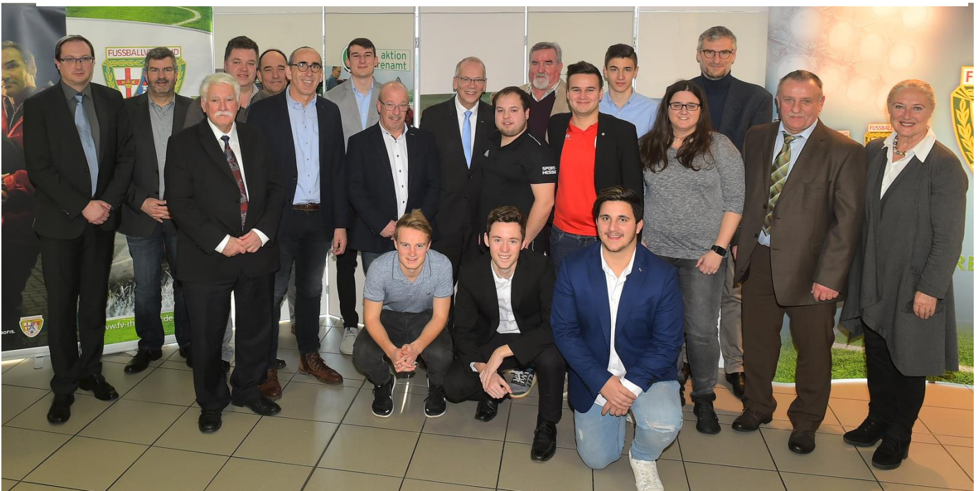
Preisträger Tag des Ehrenamts – alle Geehrten des Tages